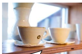
Donut cafe 豆豆.zuzu