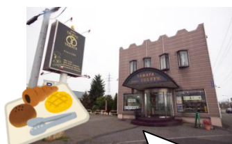
プチ・トリフ山屋