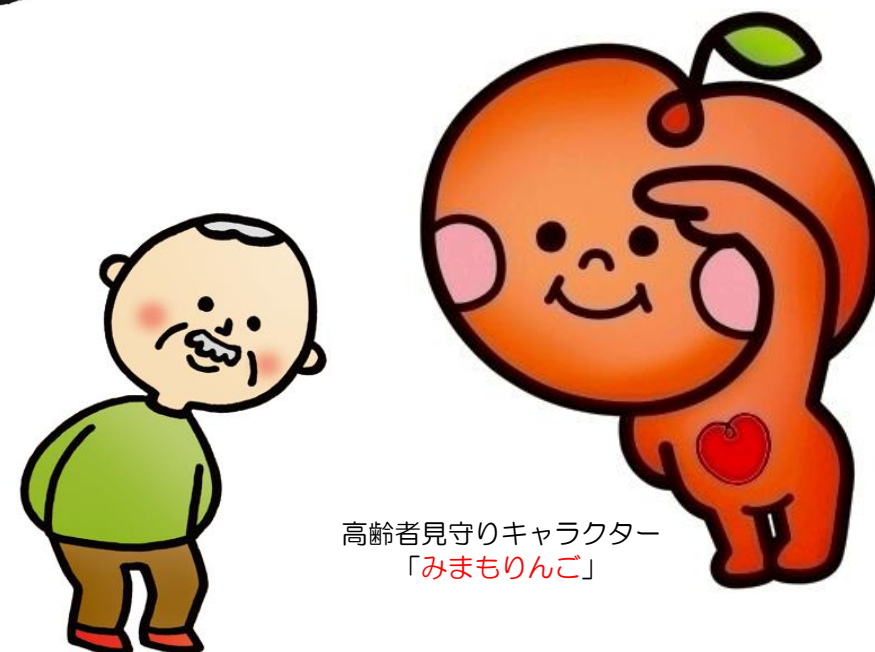
高齢者見守りキャラクター 「みまもりんご」

《砂川市高齢者支え合いネットワーク事業に関するお問い合わせは》 ☆砂川市保健福祉部介護福祉課高齢者支援係（市役所⑦番窓口） TEL0125-54-2121 FAX0125-55-2301 ☆ささえあいセンター（砂川市地域包括支援センター） TEL0125-54-3077 FAX0125-54-3091