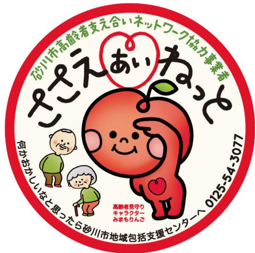
「高齢者支え合いネットワーク事業」ステッカー

「高齢者支え合いネットワーク事業」の取組みを広く市民のみなさんに知っていただくため、協力事業者には、店頭、車両等に下記のステッカーの貼付をお願いします。