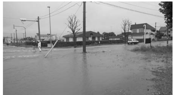
▲空知太黄金通り冠水