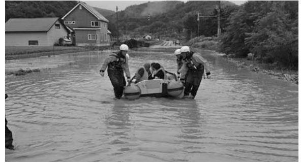
▲焼山地区冠水救助