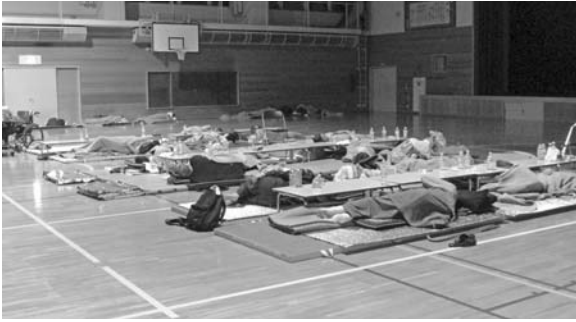
▲豊沼小学校避難所