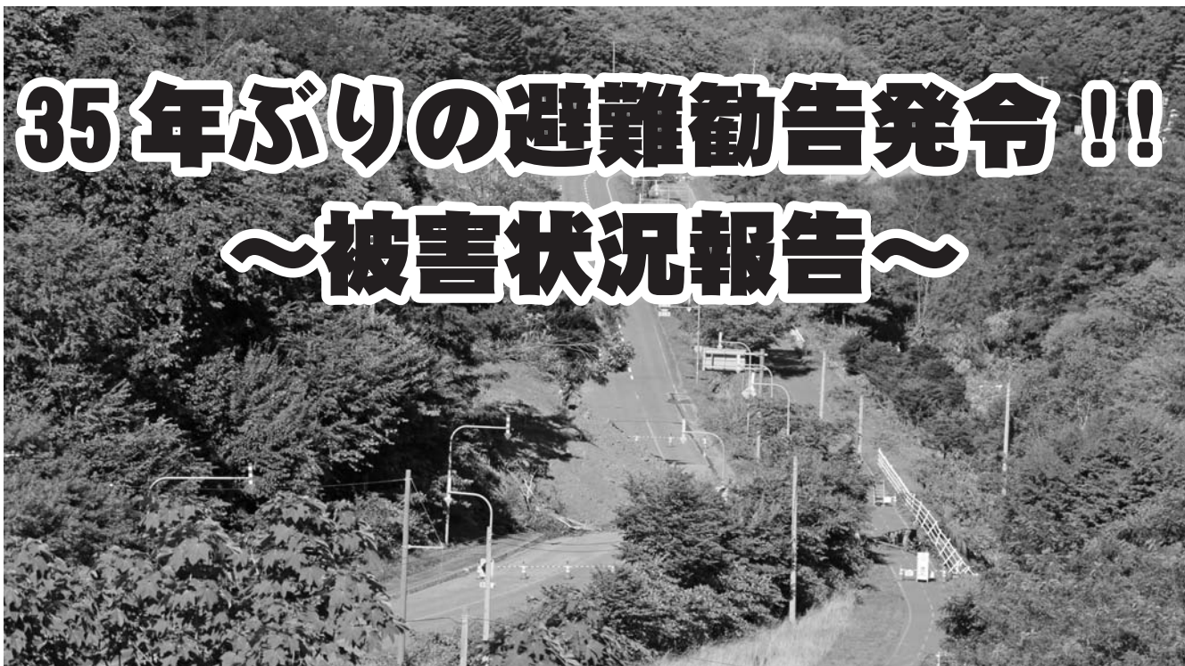
▲土砂崩れが発生し、道道627号文珠砂川線と焼山自転車道が通行止めとなる

前線や台風11号および9号による断続的な大雨の影響により、昭和56年の水害以来となる避難勧告を発令しました。市内においても、豊沼奈江川の氾濫に加えて各地で土砂災害、浸水などが起こり、浸水による建物被害や商業被害、田畑の冠水など農業への被害、道路冠水や土砂崩れなどによる交通障害が発生しました。