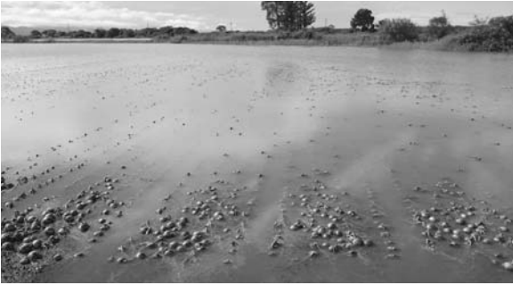
▲袋地地区たまねぎ畑冠水