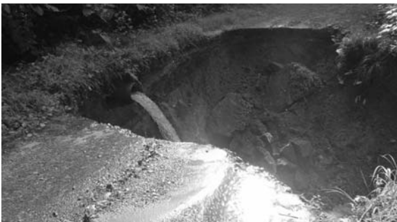
▲宮城の沢地区道路陥没