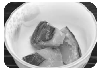
エネルギー 68kcal たんぱく質 2.9g カルシウム 61mg 塩分 0.4g