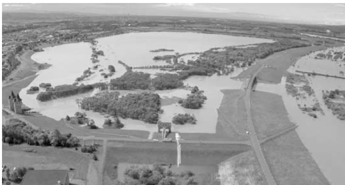
▲8月21日 大雨により増水する遊水地