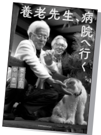
『養老先生、病院へ行く』 (養老孟司、中川恵一 / 著)

病院嫌いな解剖学者・養老先生が生 死の境をさまよった大病や愛猫・まる の死を通して、医療との関わりや限界 と可能性、人生と死への向き合い方な ど自らの経験を通して考えたこと・感 じたことを、教え子でがん患者である 東大病院の医師・中川恵一と語り合う。