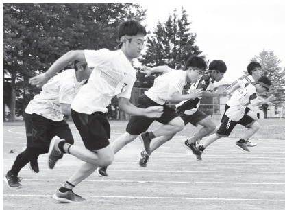
●石山中学校 代表選手の力強いスタートダッシュ！