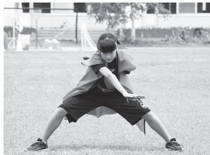
●北光小学校 よさこい演舞で決めポーズ☆