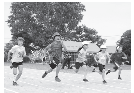
●空知太小学校 誰が一番にゴールするかな？