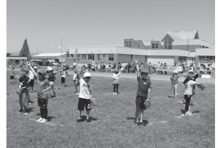
●中央小学校 リズムにのってダンス！

初夏の青空の下、児童生徒の皆さんは徒競走やリレーなどの競技を一生懸命に行い、会場はクラスの仲間を応援する声で盛り上がっていました。皆さん大変お疲れさまでした！