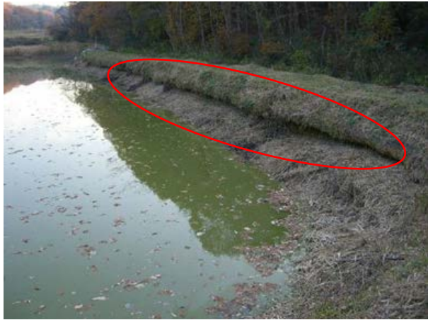
【堤体上流法面などに損傷や浸食箇所がある】