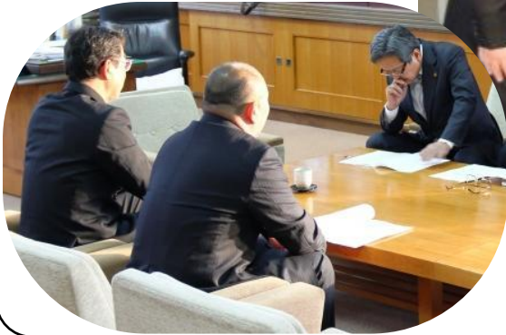
【写真：左】建議事項や農業情勢について、約1時間にわたり討議されました。