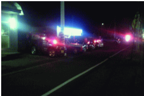
砂川市運転手会のみなさん