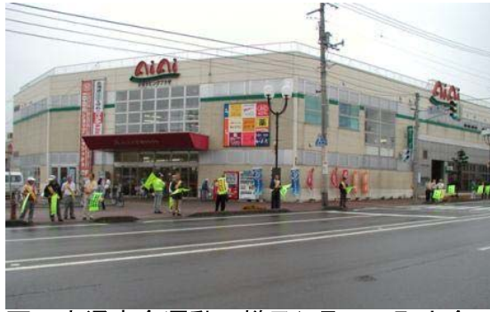
夏の交通安全運動の様子(7月15日町内会連合会による旗の波街頭啓発)