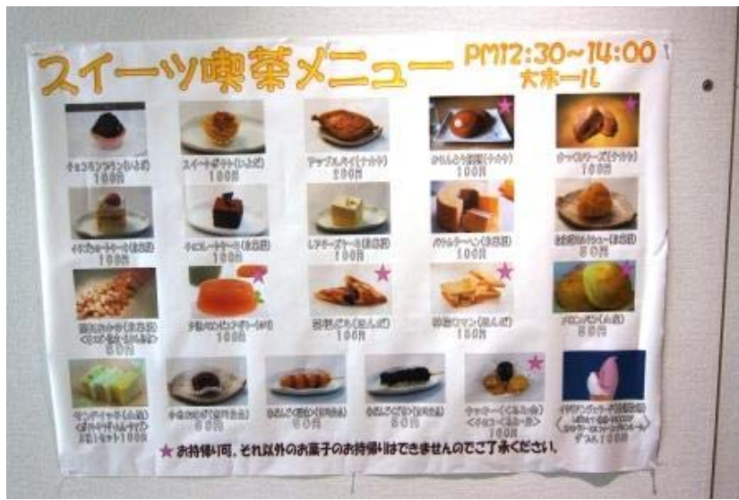
スイーツフェスタ終了後に行われた、「スイーツ喫茶」。好きなお菓子を1個単位で買うことができます。