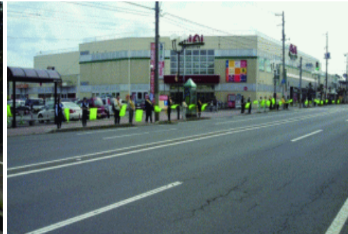
村田施設工業グループ公和会のみなさん