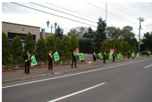
株式会社ホリのみなさん