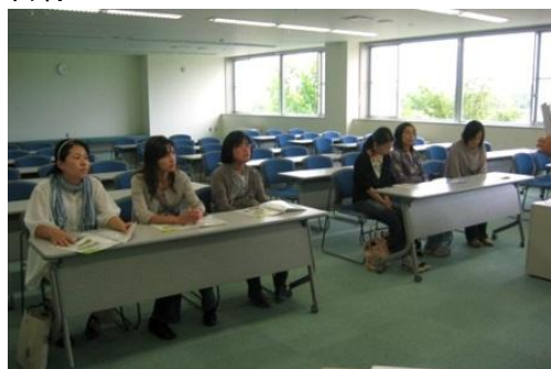
9月12日 砂川コープ会の皆様