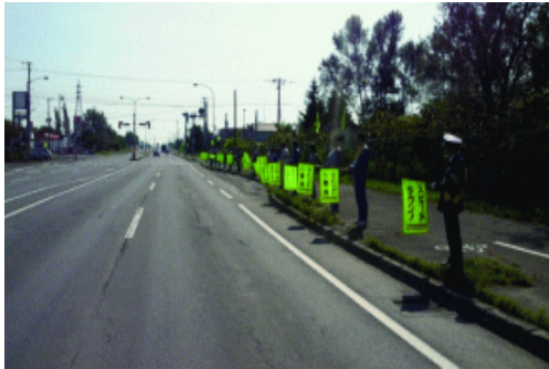
北海道電力砂川発電所のみなさん