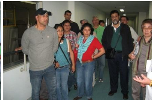
9月8日 中南米諸国の技術系行政官の皆様