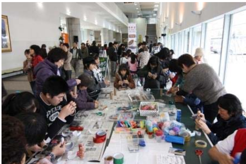
手づくり万華鏡コーナーです

スイーツ・フェスタにご支援くださいましたスイートロード協議会の方々に、厚くお礼申し上げます。ありがとうございました。