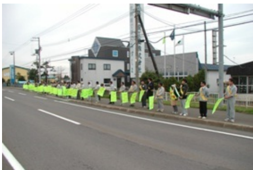
水島建設工業株式会社のみなさん

砂川警察署始め関係団体の皆様が積極的に活動されています。 市民の皆様とともに交通事故撲滅を願っています。