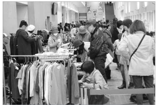
●同時開催のゆう楽市也大盛況でした