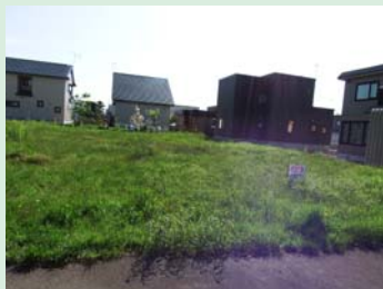
「あかね分譲地 区画番号20番」