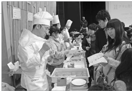
●実演販売も行われました