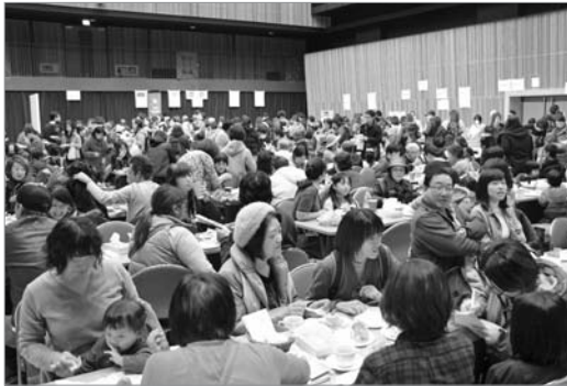
●甘党たちが詰め掛けました

すながわスイーツフェスタが行われ、スイートロードのお菓子を目当てにスイーツ好きの大人や子どもが集まりました。開場前から長蛇の列ができ、1時間ほどで商品が完売するなど、予想を上回る人気ぶりで、砂川で人気のスイーツをほおばる人たちで会場はあふれかえりました。