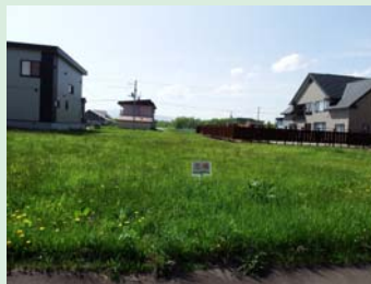
「すずらん分譲地 区画番号109番」