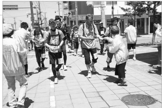
●砂川のお菓子で元気をチャージ!

第16回空知単板工業㈱チャリティー100キロウォーク大会が行われ、砂川市を含めた100キロの行程をそれぞれ完歩を目指してゴールのふれあいの里に向かいました。途中スイートロード協議会によるお菓子のおもてなしがあり、参加者はもらったお菓子を手に次のチェックポイントへの活力としました。