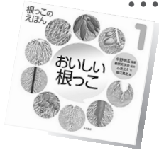
『根っこのえほん』 (全5巻)

ふだんは土の中にあって隠れていることが多い植物の根っこに注目。おいしく食べられる根っこから、水中の根っこや大きな木の根っこなどいろいろな根っこを紹介しています。植生や簡単な栽培法などのミニ知識も掲載。仕掛け絵本の形式で楽しみながら植物について学べます。