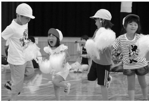
●みんなでダンス楽しいね!

市内各保育所運動会が行われ、園児たちはそれぞれ練習した成果を存分に発揮しグラウンドや体育館を一生懸命走ったり、踊ったりしていました。小さなクラスの子どもたちは1人になってしまい泣いてしまう場面もありましたが、4歳・5歳児のクラスは楽しみながら力いっぱい競技に取り組んでいました。