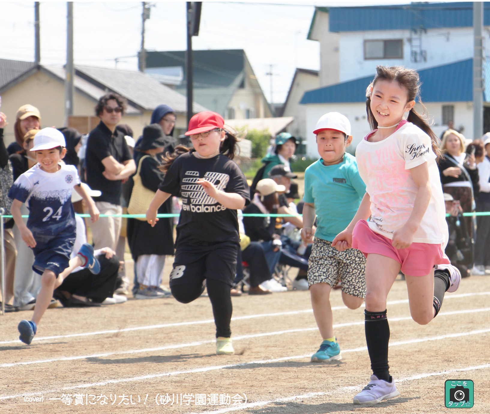
(cover) 一等賞になりたい！(砂川学園運動会)