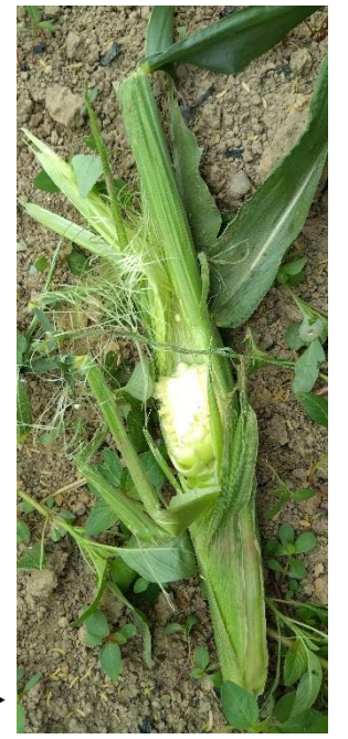
ヒグマの被害を受けた農作物▶