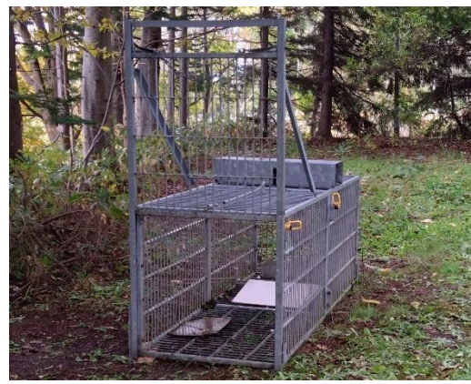
▲ヒグマ捕獲用の箱わな